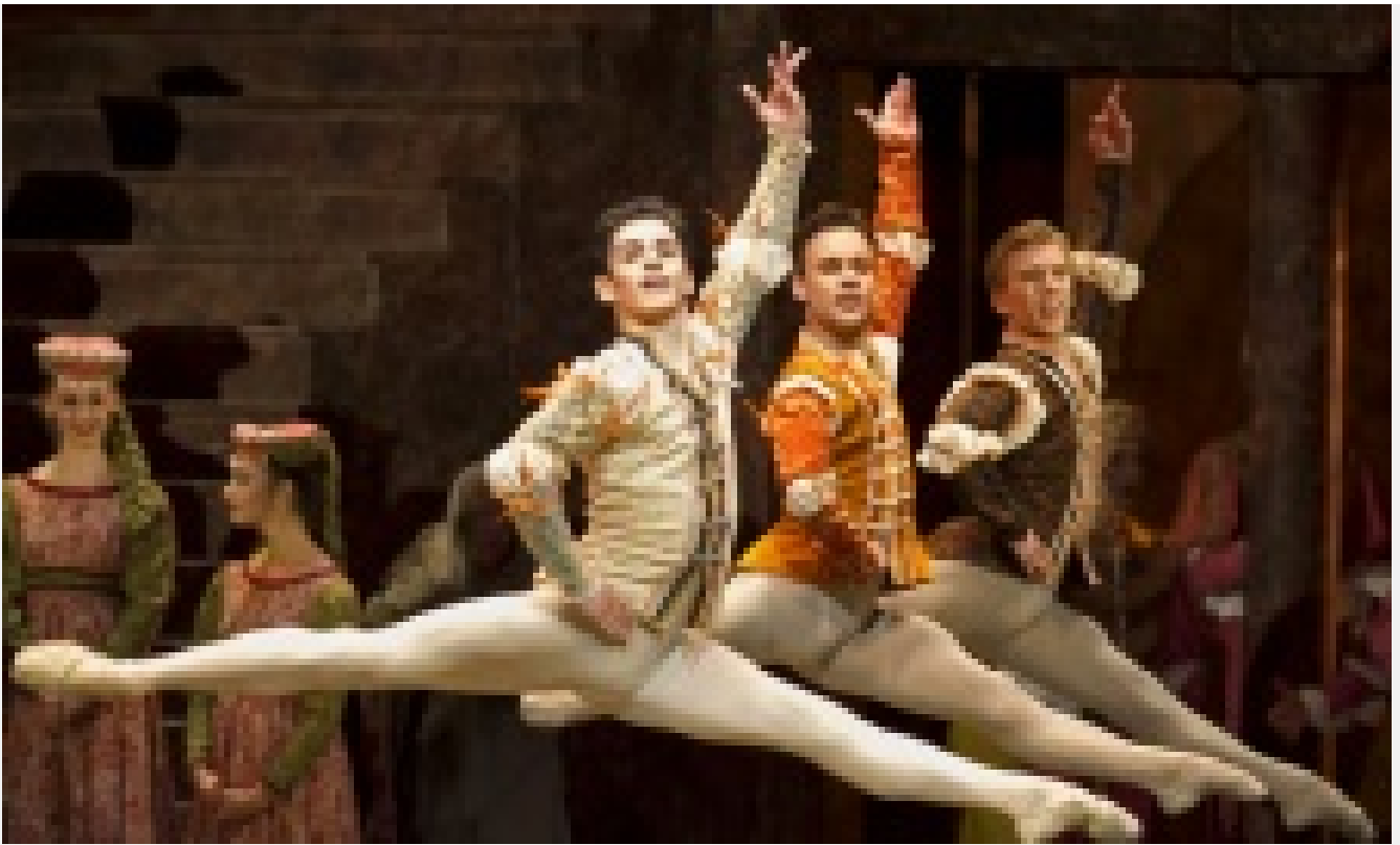
L'eterna vicenda di Romeo e Giulietta