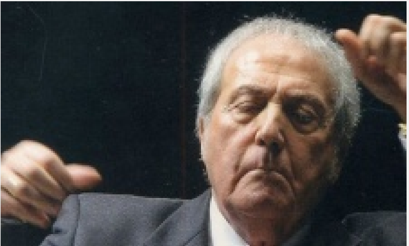
La scomparsa di Aldo Ciccolini