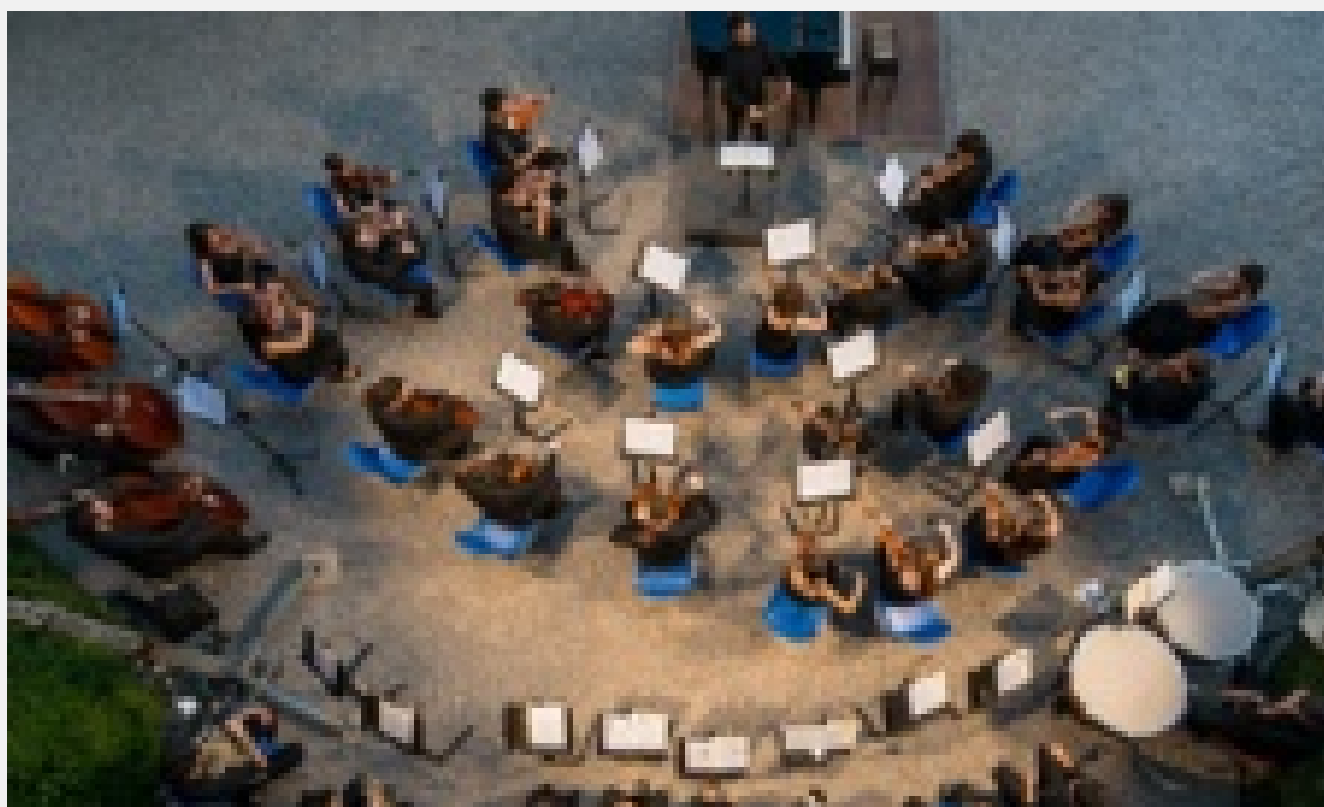
Un concerto per la "Cometa"